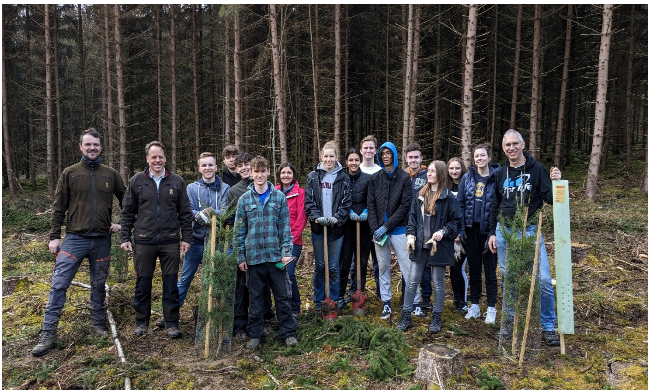
P-Seminar Klimaschutzschule 2023/24 bei der Baumpflanzaktion

Durch weitere Projekte in anderen Bereichen können zwar nur geringe Einsparungen erzielt werden, aber durch die Sensibilisierung für die jeweiligen Themen können die Maßnahmen über die Schule hinaus wirken.