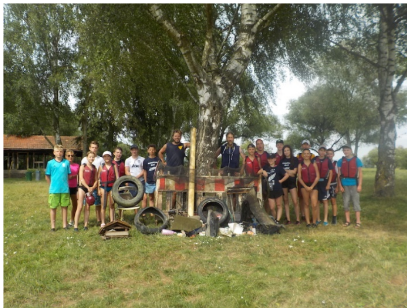
Ergebnisse der Müllsammlung auf der Kanutour 2017

Die Wahl dieser Klassenfahrt unterstreicht unser Engagement für nachhaltigen Tourismus, Naturverbundenheit und die Reduzierung von Treibhausgasemissionen durch Aktivitäten wie Paddeln und Zelten. Die Schülerinnen und Schüler werden für Umweltfragen sensibilisiert und es wird besonderer Wert auf den Schutz der Natur entlang des Flusses gelegt.